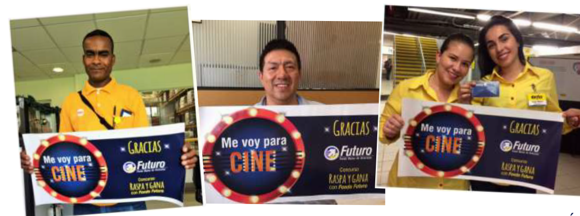
Ubaldo Esalas Regional Centro

Muchos colaboradores han tenido la oportunidad de participar por entradas a cine con su combo por vincularse a Fondo Futuro durante nuestras visitas a cada dependencia, espéranos y haz parte de nuestros felices ganadores.